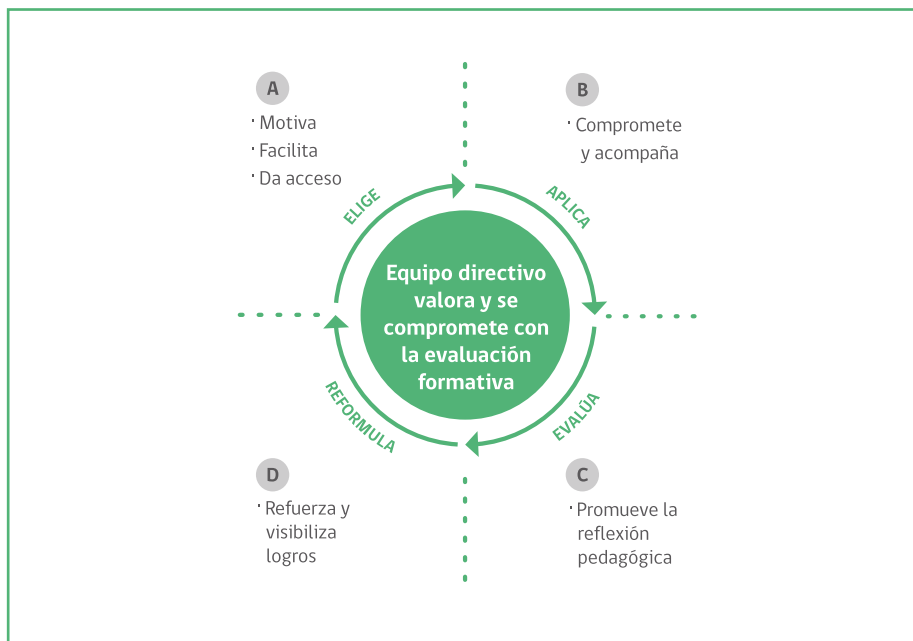
Diagrama 2. Ciclo de Uso de la Evaluación Formativa/ Equipo Directivo

El apoyo del equipo directivo debe ajustarse y responder a las necesidades que experimenta cada docente en las distintas etapas del proceso. El siguiente diagrama ilustra algunas de los roles que tienen los directivos en los momentos clave para el buen uso de los recursos del proyecto.